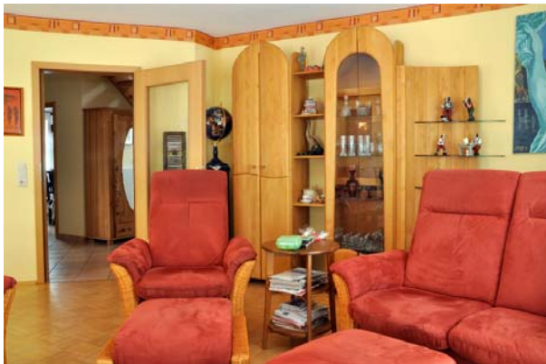
Wohnzimmer & Diele