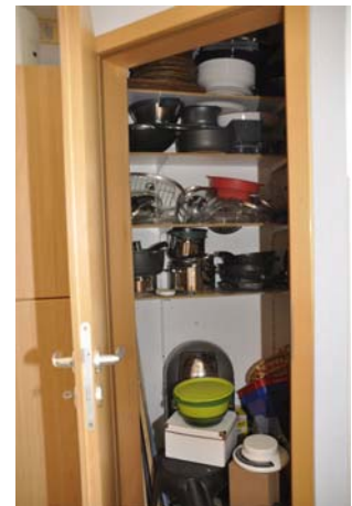
Vorratsraum in der Küche