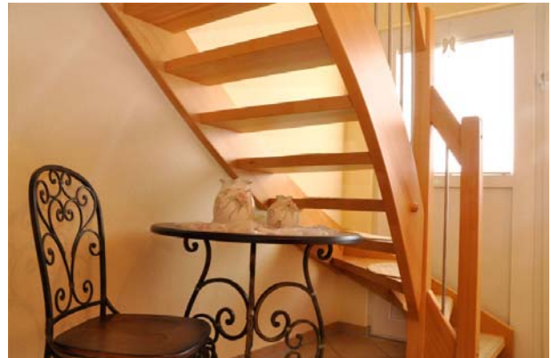
Diele mit Treppe