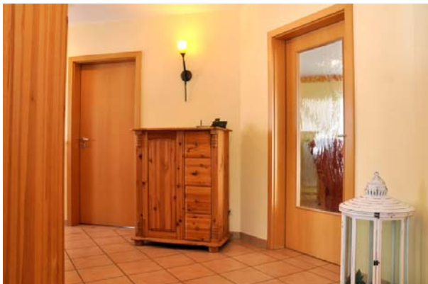
Diele mit Zugang Wohnzimmer rechts und Hauswirtschaftsraum hinten links