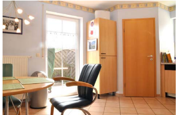
Küche mit Zugang Terrasse