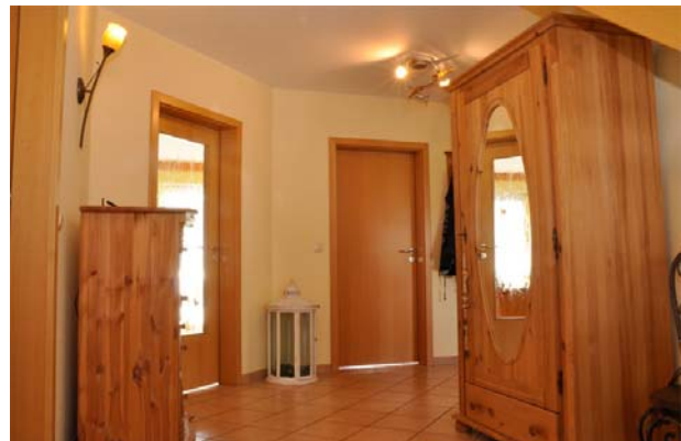
Diele mit Zugang Wohnzimmer links und Küche hinten rechts