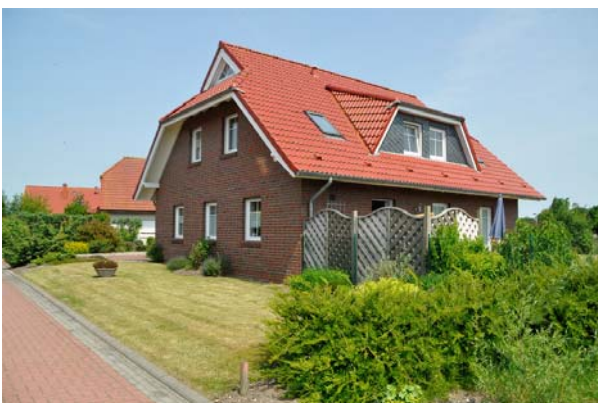
Süd-West Ansicht mit Quellerstraße