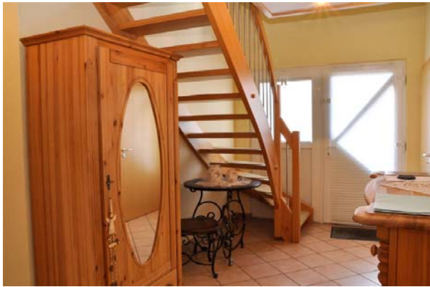
Diele mit Front-Eingang und Treppe